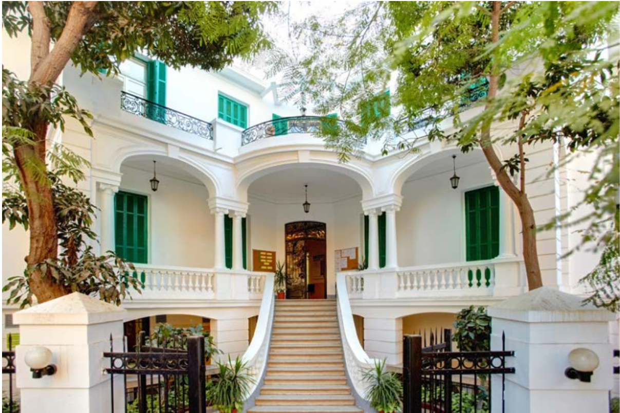
(fig.)Goethe Institut Kairo 2016

„ Gott der Schöpfer ist der erste Töpfer.