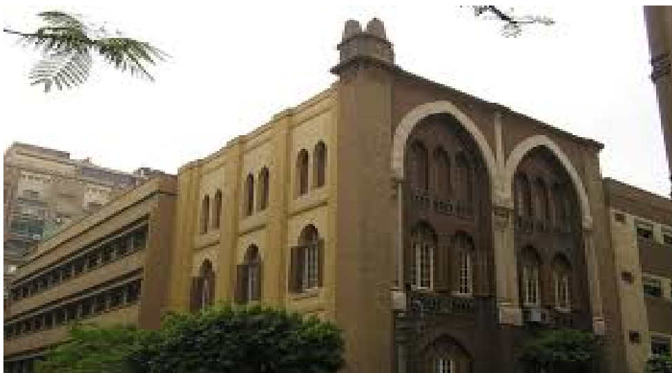
(Abb.) Gebäude der Deutschen Schule der Borromärinnen in Kairo, erbaut 1904. (2015).