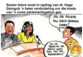
Spotprent vir 1 Junie 2016